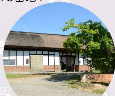
栗原市（宮城県）