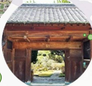
紀の川市（和歌山県） 「門リトリートサロン 有蘭様ご提供」