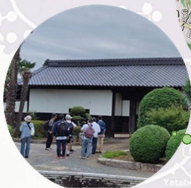
つくば地区（茨城県） 「NPO法人つくば建築研究会」